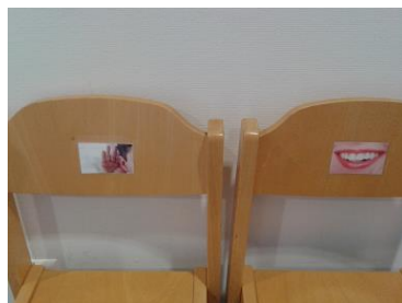
Wir setzen uns auf den Mund- und Ohren-Stuhl.