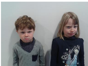
Wir haben Streit.