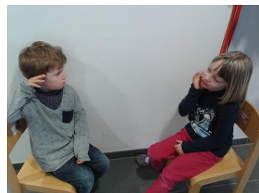
Ich höre zu. Du erzählst, was dich wütend/traurig macht.